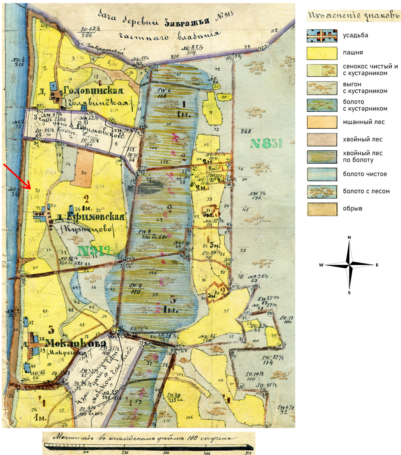
Рис. 1. Карта прилегающей к Соколкам местности, план дач генерального межевания 1905 г. по съемке 1894 г. (из фондов Котласского краеведческого музея, публикуется впервые). Стрелкой обозначено место раскопок.