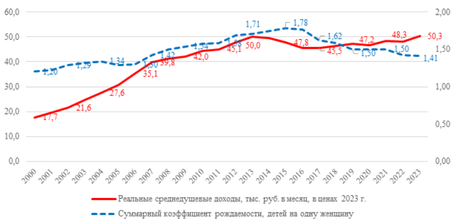
Рисунок 1. Динамика доходов и уровня рождаемости в Российской Федерации за 2000–2023 годы. Figure 1. The dynamics of income size and birth rate in the Russian Federation for 2000–2023.

Позитивными сдвигами можно считать появление в стратегических целях России и многих регионов демографических показателей. Но в этой кампании остается открытым вопрос: а где же любовь? «Бескорыстная, са-